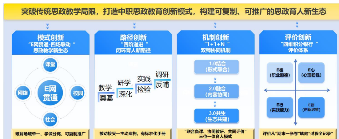
图 5 打造中职思政教育创新模式

颠覆传统结果性评价，本成果依托数字化平台，从“E德（职业道德）、E心（心理韧性）、E行（实践能力）、E创（创新思维）”四个维度，全过程、多场景采集学生在四个场域的行为数据。系统自动生成可视化的个人思政素养“雷达图”和“成长轨迹”，记录学生在课堂、校园、社会、网络的表现，形成动态“成长画像”。评价结果作为评优评先、实习推荐的重要依据，实现了思政评价从“期末一张卷”到“过程全记录”、从“模糊定性”到“精准定量+增值评价”的飞跃。