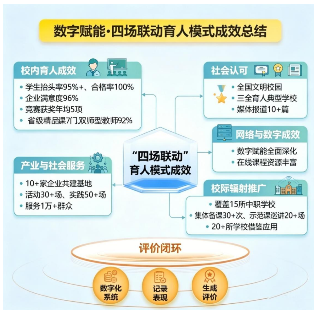
图 5 育人模式成效

文明校园”“三全育人典型学校”。《福建日报》、《海峡教育报》、福建教育电视台等媒体累计报道 10 余篇。用人单位普遍评价“福邮毕业生技能强、靠得住”，学校成为区域中职思政教育改革的标杆。