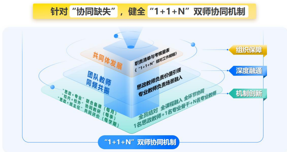
图3 健全“1+1+N”双师协同机制