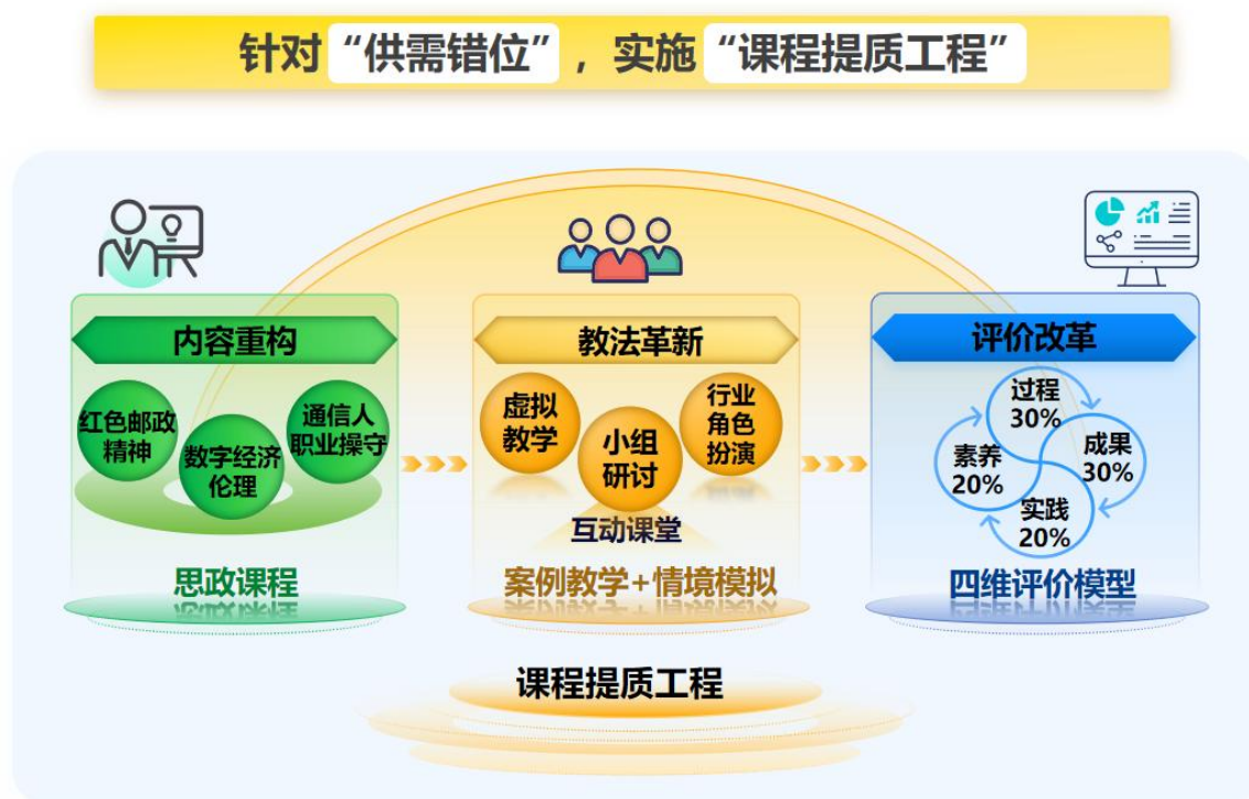
图 2 实施课程提质工程