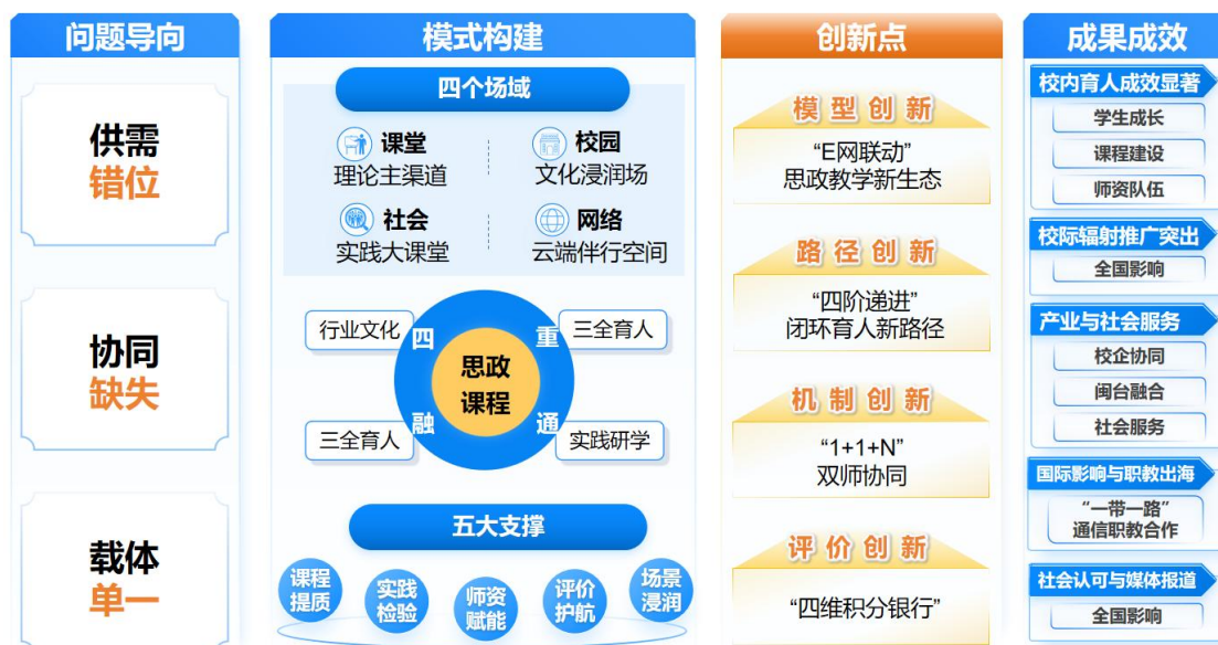
图 1 “E网贯通·四场联动”教学创新与实践成果

推广应用：成果被 20 余所省内外中职校借鉴，被《福建日报》等主流媒体报道 10 余次，并在全省性德育工作会议上作典型发言。